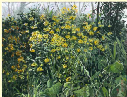
是澤清一「夏草火災」油彩 2018年

彼の作品に描かれるのは、田川をはじめとした自然や街並み。しかし、そこに人の姿は見当たりません。時代とともに変わりゆく風景の中で、彼は何を描こうとしたのか—その作品に込められた思いを、本展を通じて探ります。